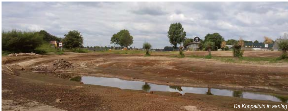
De Koppeltuyn in aanleg

De tuin is ontworpen door kunstenaars Carmela Bogman en is een voorbeeld van de functionele kunst die in het hele Vechtpark toegepast wordt.