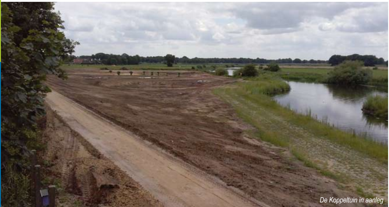
De Koppeltuin in aanleg

Tegelijkertijd is het gebied rond De Koppel voor leerlingen van de Groene Welle een mooie plek om de theorie in de praktijk te brengen. “Voorgaande jaren hebben ze bijvoorbeeld wel eens de opdracht gehad om een plan voor een park op deze plek te maken. Dan was het de bedoeling dat ze er goed over